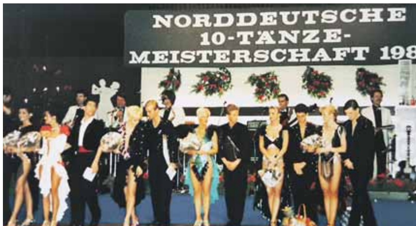
Das waren noch Zeiten in den 80ern: Norddeutsche 10-Tänze-Meisterschaften in der Buxtehuder Festhalle.