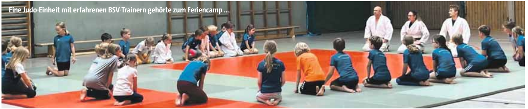
Eine Judo-Einheit mit erfahrenen BSV-Trainern gehörte zum Feriencamp ...