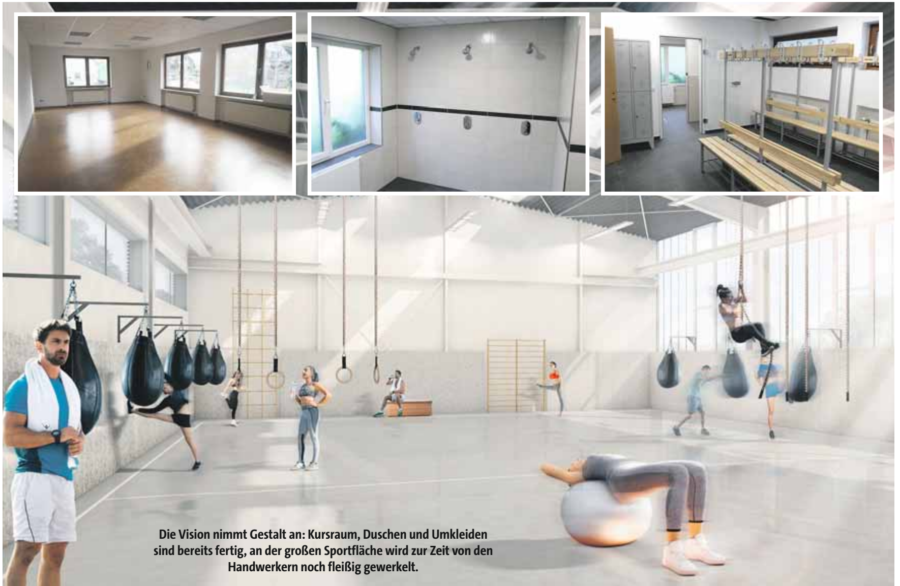
Die Vision nimmt Gestalt an: Kursraum, Duschen und Umkleiden sind bereits fertig, an der großen Sportfläche wird zur Zeit von den Handwerkern noch fleißig gewerkelt.

Neben ärztlich verordnetem Rehasport für orthopädische Erkrankungen und Erkrankungen der Lunge werden wir im Kraftwerk auch Rehasport nach Schlaganfall und Parkinson anbieten, denn besonders der Gesundheitssport liegt dem BSV sehr am Herzen. Ein ganz aktuelles Thema wird der Rehasport nach COVID sein, was derzeit viele