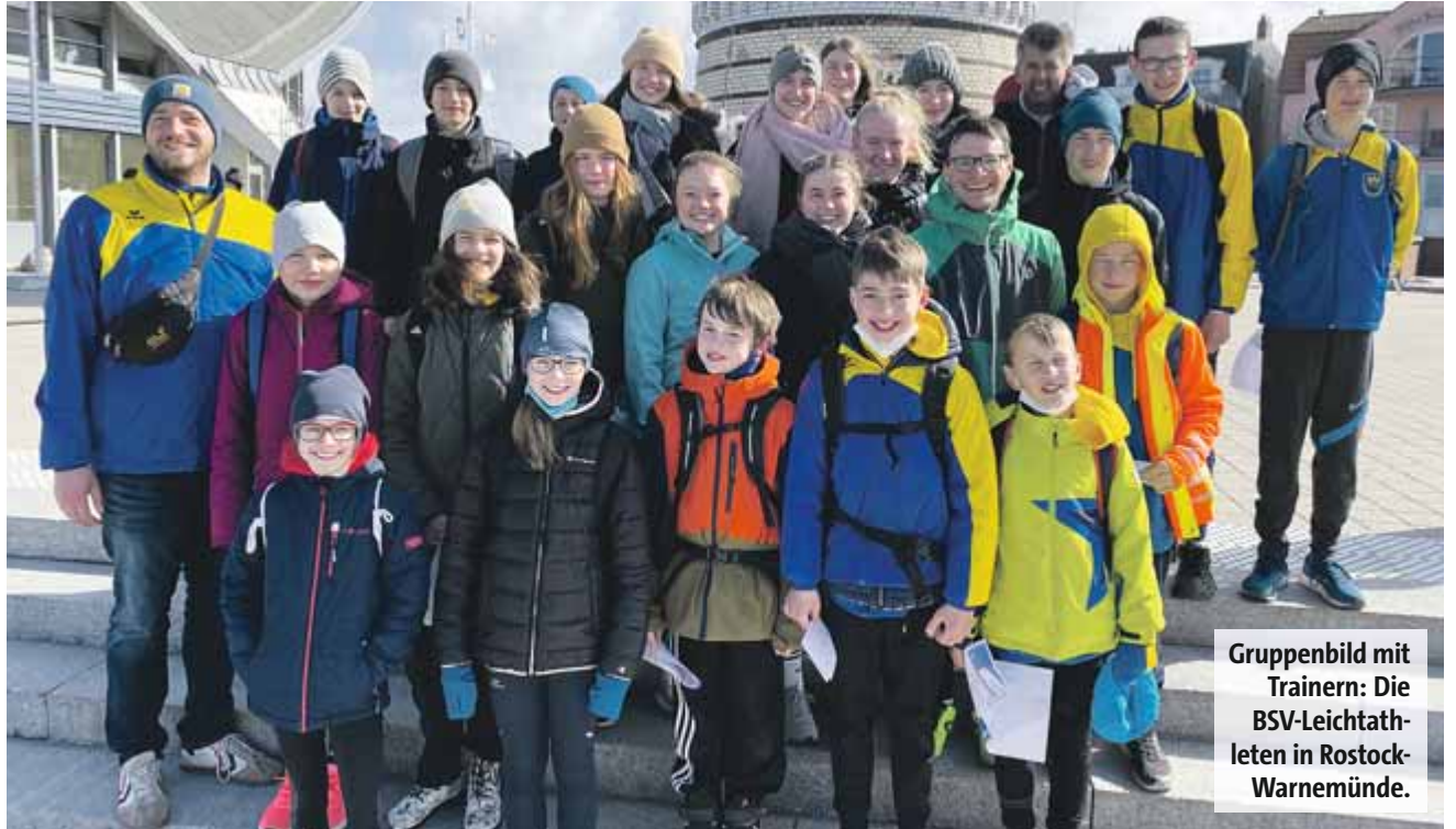
Gruppenbild mit Trainern: Die BSV-Leichtathleten in Rostock-Warnemünde.

Für den Vormittag stand eine Radtour entlang der Ostseeküste ins 15 Kilometer entfernte Heiligendamm auf dem Programm. Der permanente Ge-