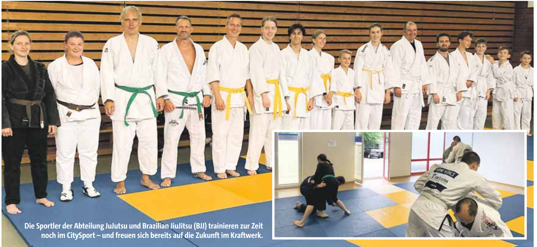
Die Sportler der Abteilung Jujutsu und Brazilian JiuJitsu (BJJ) trainieren zur Zeit noch im CitySport – und freuen sich bereits auf die Zukunft im Kraftwerk.