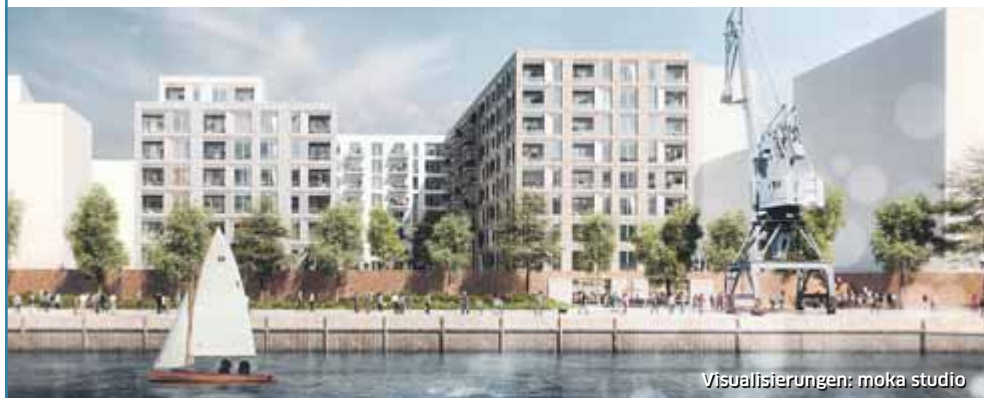
Visualisierungen: moka studio