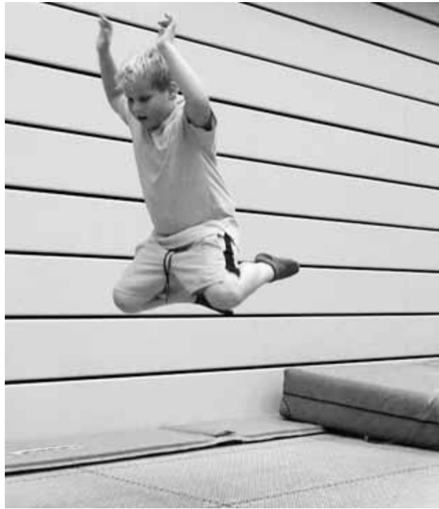
Ob Turnlandschaft oder das große Trampolin – Bewegung macht den Kindern Spaß