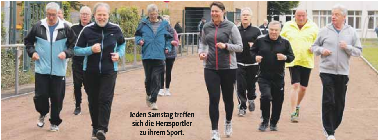
Jeden Samstag treffen sich die Herzsportler zu ihrem Sport.

Wer auch am Herzsport teilnehmen möchte, braucht dafür eine Verordnung vom Arzt.