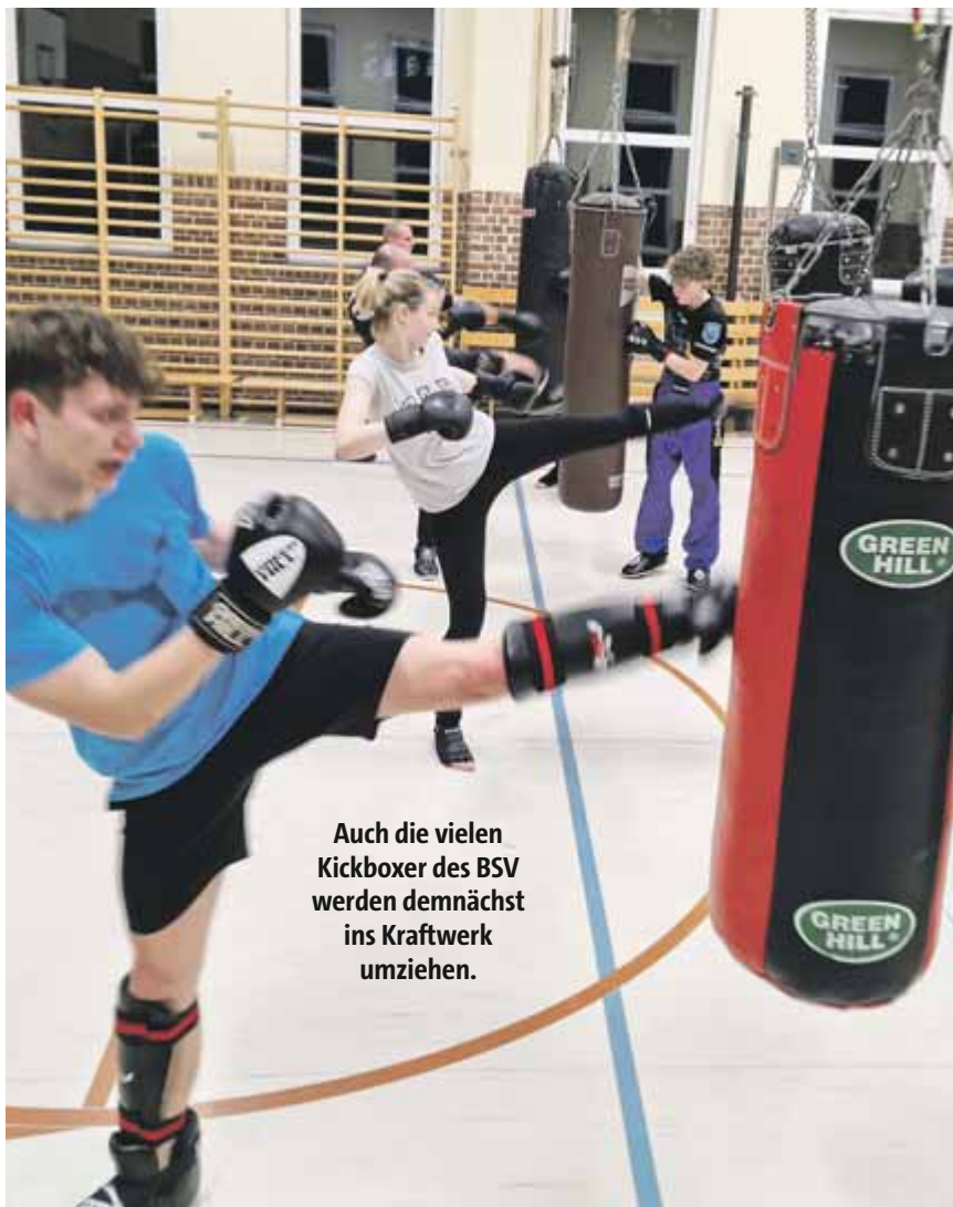
Auch die vielen Kickboxer des BSV werden demnächst ins Kraftwerk umziehen.

Fitness fördern durch Kickboxen? Unser Training bietet hier die perfekten Voraussetzungen, da wir beim Training und der Vorbereitung für Wettkämpfe vollen Körpereinsatz und Konzentration benötigen. Kickboxen besteht nicht nur aus einzelnen Techniken, sondern auch aus einer Mischung von Ausdauersport und Krafttraining. Es eignet sich somit optimal, um die während der letzten Jahre gesammelten Pfunde durch Muskelmasse zu ersetzen.