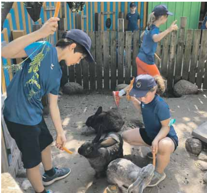
Viel Spaß hatten die Kinder mit den Tieren auf dem Kinderbauernhof.

Wir freuen uns schon auf das nächste Feriencamp.