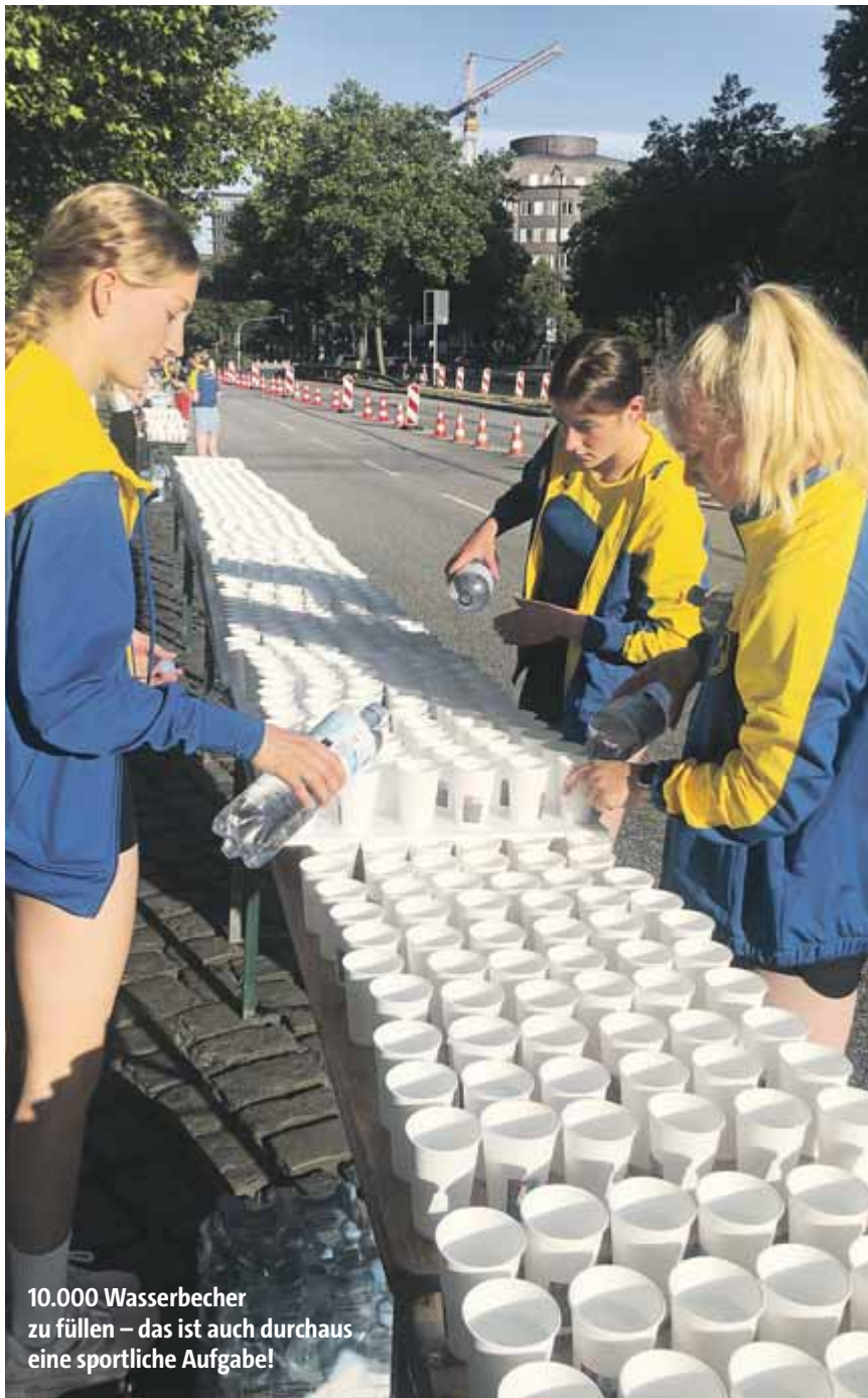
10.000 Wasserbecher zu füllen – das ist auch durchaus eine sportliche Aufgabe!