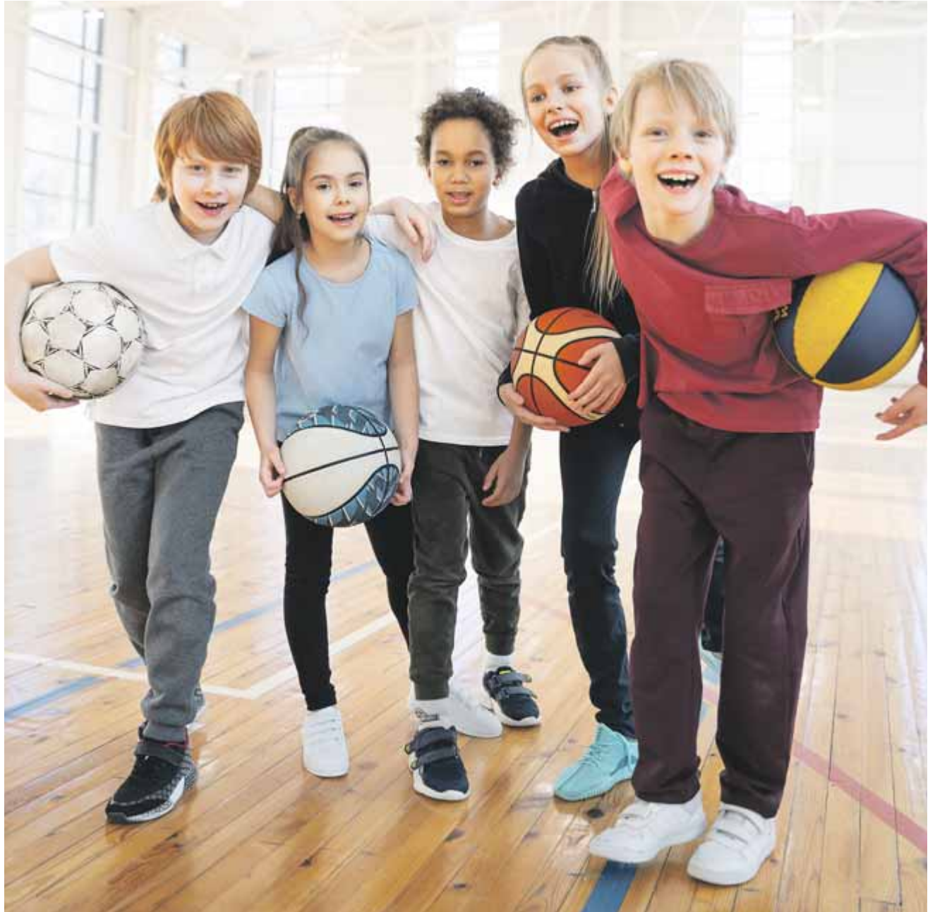
Das Konzept der Kindersportschule: Keine frühzeitige Spezialisierung, sondern möglichst viele verschiedene Sportarten ausprobieren und kennenlernen.

Um dies zu gewährleisten, arbeiten wir mit einer maximalen Gruppengröße von 15 Kindern. Jede Gruppe besteht aus einem Jahrgang, maximal zwei Jahr-