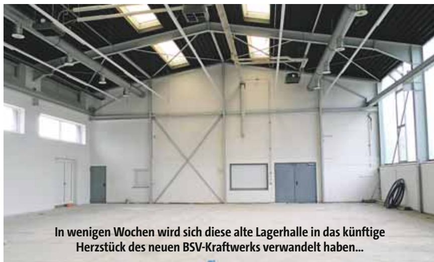
In wenigen Wochen wird sich diese alte Lagerhalle in das künftige Herzstück des neuen BSV-Kraftwerks verwandelt haben...

Wir hoffen, dass Ihre/Eure Neugierde geweckt ist und wir Sie/Euch schon bald im Kraftwerk im Brillenburgsweg begrüßen dürfen!